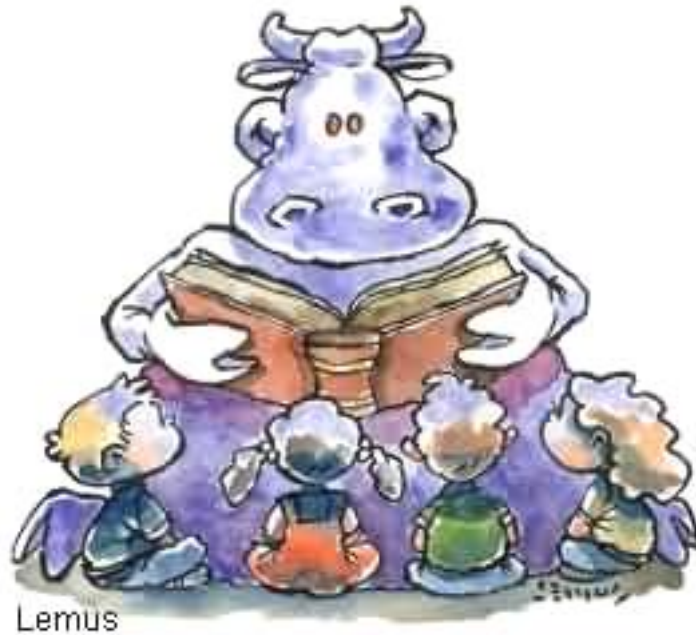
Ilustración de Lemus solicitada por El Ucabista para ilustrar el texto “ Desde la gente que escucha y cuenta cuentos ”, octubre de 2002