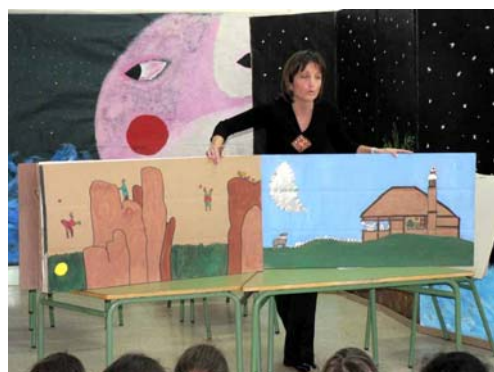
"El tesoro de la luna

Y, por fin, se pusieron manos a la obra llevando a la práctica algunas propuestas de trabajo plástico y literario. Los peques de Ed. Infantil recortaban y decoraban lunas que luego se pegaban a un palito y acababan en maceteros colocados en diferentes ventanas del colegio formando un paisaje