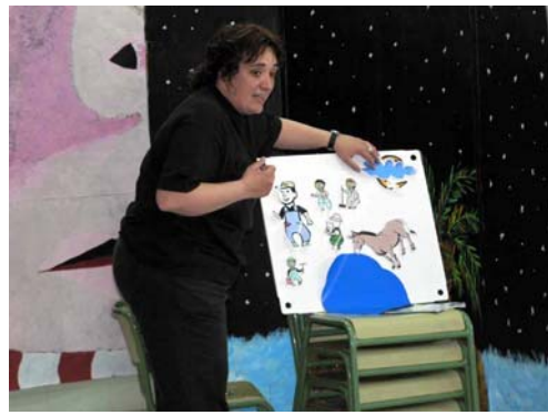
"La hija del sol y de la luna",